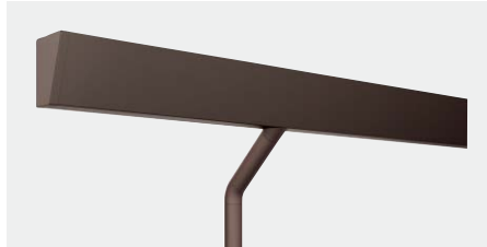
KZA5160 ディープブラウン