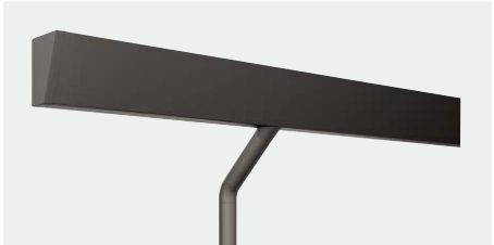
KZA6160 スレートブラック